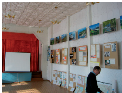
Préparation de l'expo «Les Hommes et le Lac»

de Khoujir et d'Elantsy). Des jeunes filles, accompagnées par un accordéoniste ex-professeur d'anglais, chantent en français. Une après-midi émouvante. L'exposition est maintenant en Haute-Savoie. Le soir nous lisons – 18 ° au thermomètre.